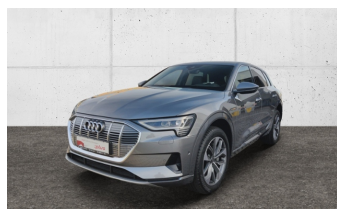
SCHULZ & STRAUBE