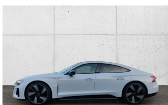
Audi Gebrauchtwagen plus