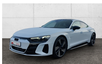
SCHULZ & STRAUBE