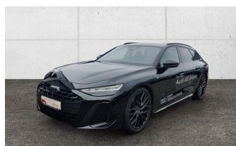
SCHULZ & STRAUBE Audi Gebrauchtwagen plus