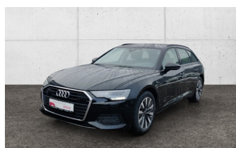
SCHULZ & STRAUBE