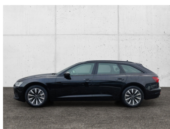
Audi Gebrauchtwagen plus