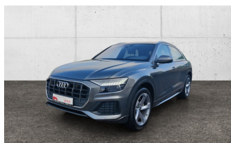
SCHULZ & STRAUBE