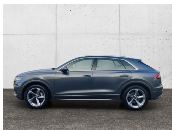
Audi Gebrauchtwagen plus