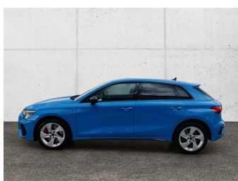
Audi Gebrauchtwagen plus