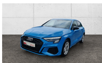
SCHULZ & STRAUBE